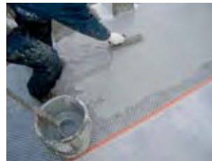
SQ Mix. 塗布