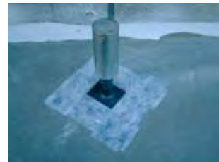
脱気筒設置 (アロンゴムシートテープ張り)