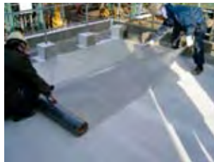
アロンTKシート張り