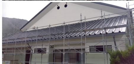
外壁 アロンウォール施工後